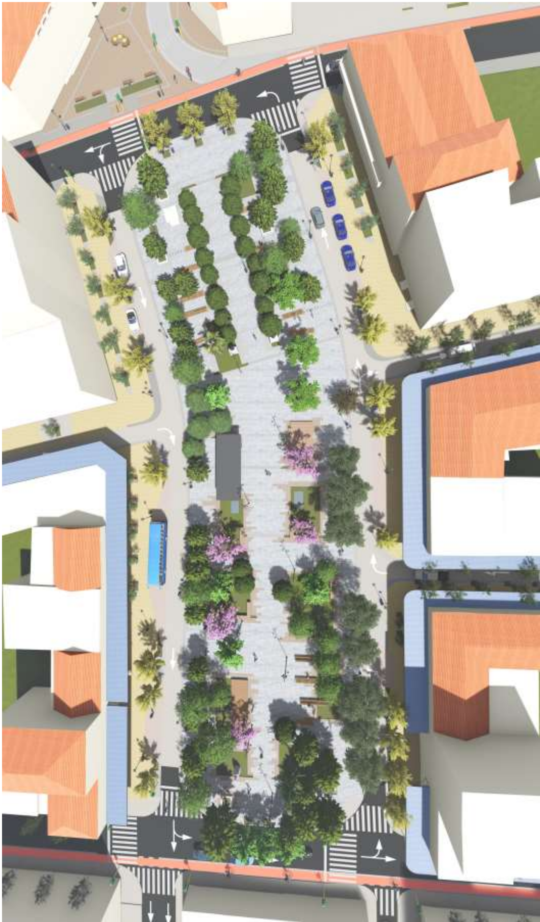
3D απεικόνιση πλατείας 1866