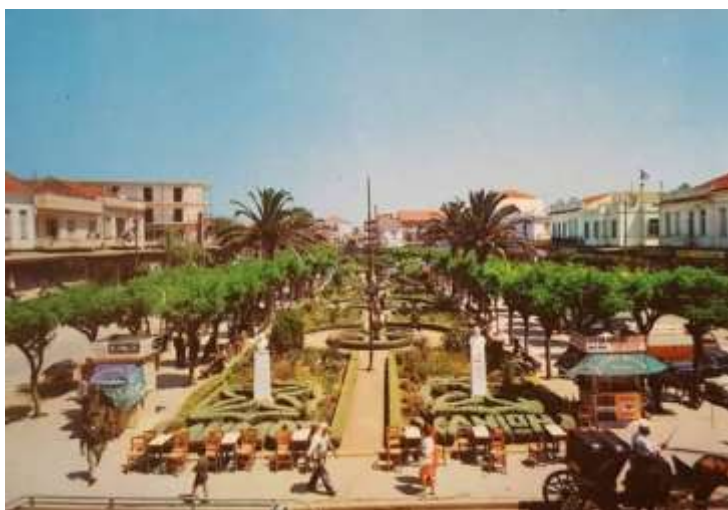
Άποψη από την οδό Κυδωνίας (1965-1970 )

Ακολουθεί συνολική αναμόρφωση της πλατείας, με μεγάλους χώρους πρασίνου. Στα νέα συμμετρικά παρτέρια κυριαρχούν κηποτεχνικές διαμορφώσεις ενώ οι βασικές διαδρομές των πεζών αναπτύσσονται περιμετρικά ανάμεσα από δεντροστοιχίες . Στην πλατεία τοποθετούνται την εποχή αυτή προτομών τοπικών ηρώων.