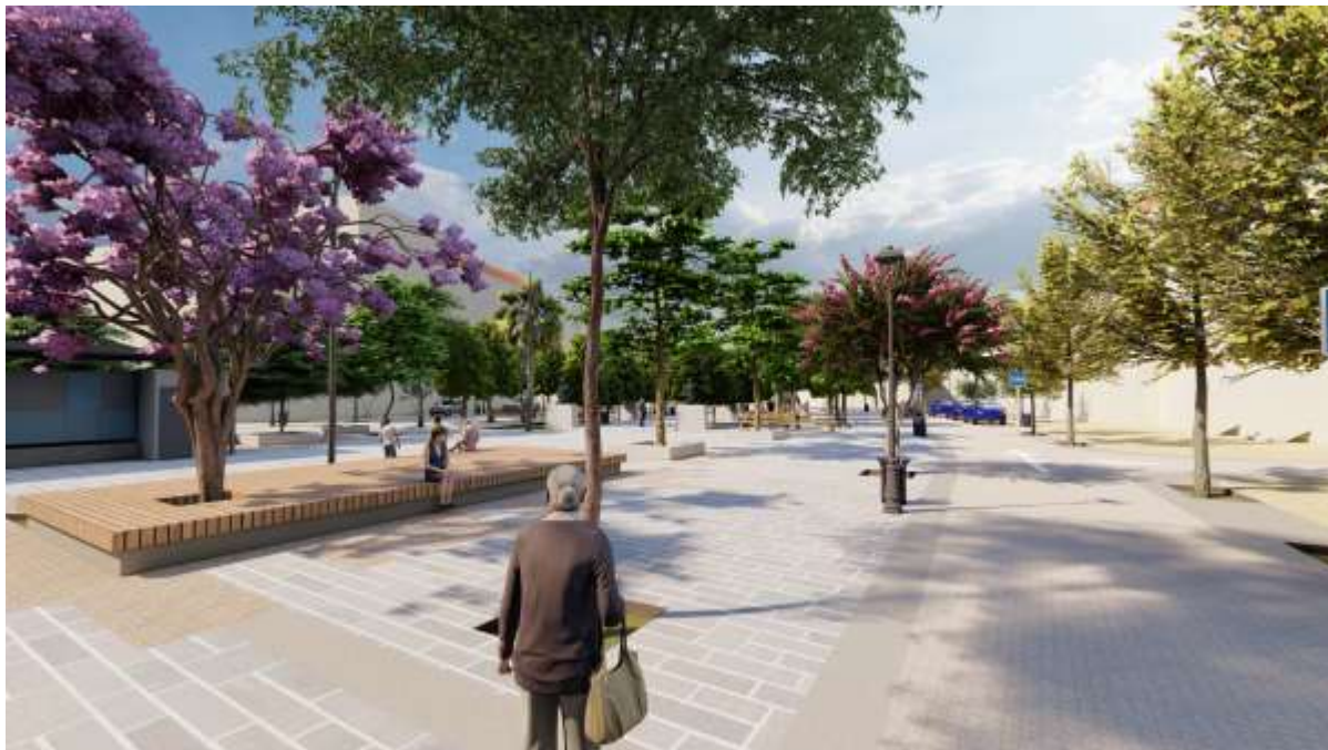
3d απεικόνιση στην κεντρική ξύλινη πλατφόρμα

Σε δύο κεντρικά ανοίγματα προς την εσωτερική διαδρομή κατασκευάζονται ξύλινες καθιστικές επιφάνειες (πλατφόρμες) που μπορούν να λειτουργήσουν και ως σκηνή για αστικές δράσεις ή σημεία συνάντησης .