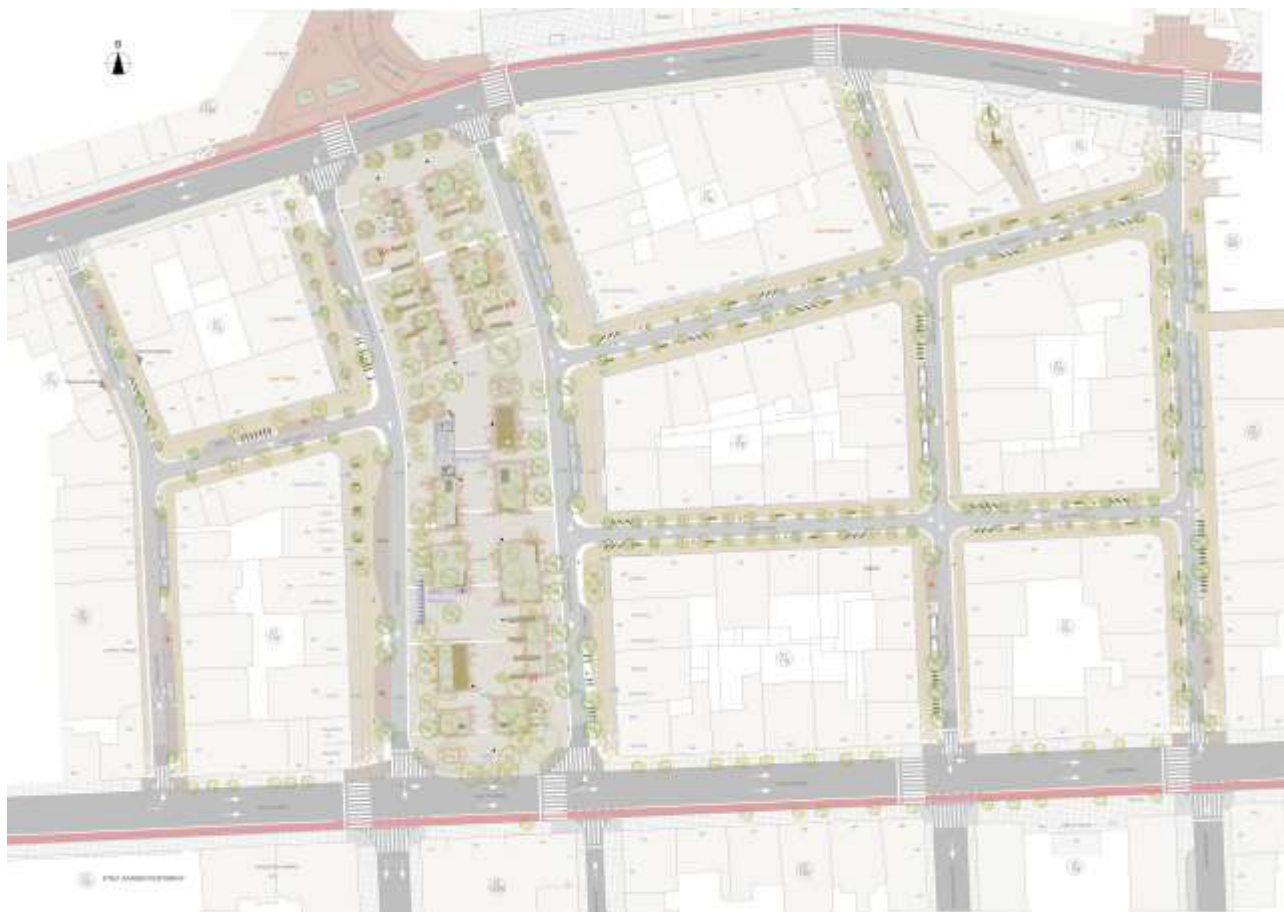
Γενική πρόταση ανάπλαση ΑΚΕ και πλατείας 1866

Ο περιορισμός του κυκλοφοριακού φόρτου και ο ορισμός του εμπορικού κέντρου ως περιοχή ήπιας κυκλοφορίας αποτελούν την βάση της ανάπλασης της περιοχής και έρχονται σε πλήρη συμφωνία με το υπό μελέτη Σχέδιο Βιώσιμης Αστικής Κινητικότητας του Δήμου Χανίων . Η ζώνη της σύγχρονης πόλης γύρω από τα ίχνη των Ενετικών οχυρώσεων και τις εισόδους του Ενετικού λιμανιού , προβλέπεται σταδιακά να μετατραπεί σε ζώνη με ήπια κυκλοφορία και έμφαση στην πρόσβαση-κίνηση πεζών και ποδηλάτων ώστε να αγκαλιάσει και να προστατεύσει το μνημείο της Παλιάς Πόλης .