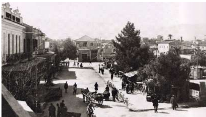
Παράγκες μικροεμπόρων περιμετρικά της πλατείας

Το σχέδιο πόλης του 1947 οριοθετεί την πλατεία 1866 και τα υφιστάμενα οικοδομικά τετράγωνα της περιοχής των νέων καταστημάτων και το 1952–53 επί δημαρχίας Νικολάου Σκουλά , με απόφαση της Δημοτικής αρχής απομακρύνθηκαν οι παράγκες και αποκαταστάθηκε ο κοινόχρηστος χαρακτήρας της πλατείας , ενώ συγχρόνως εφαρμόστηκε το νέο ρυμοτομικό σχέδιο που έφτανε μέχρι την περιοχή των Παχιανών.