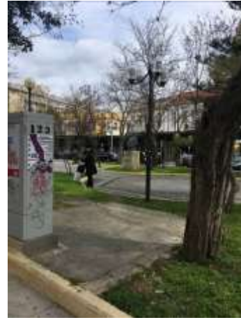
Τα παρτέρια δεν διευκολύνουν την περιήγηση στην πλατεία