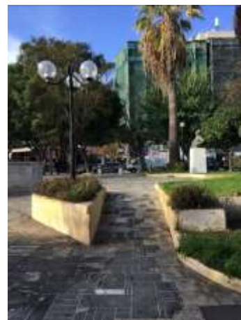
Εμπόδια στην πρόσβαση και ράμπες εκτός προδιαγραφών