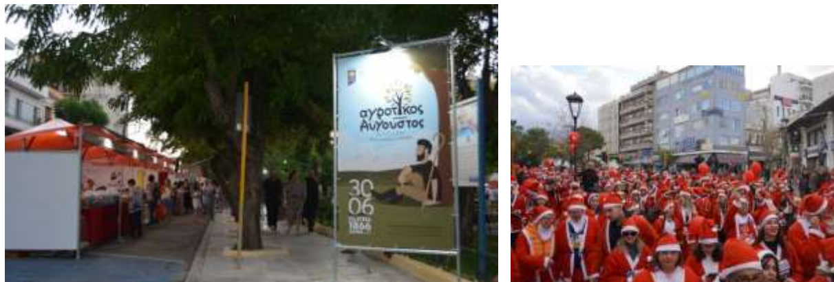
Ανάπτυξη περιπτέρων στις σημερινές εσοχές στάθμευσης | Santa Run από Χάληδων προς πλατεία 1866

Η Πλατεία 1866 περιστοιχίζεται από χώρους στάθμευσης και στάσης οχημάτων (ΙΧ, Ταξί, αστικά λεωφορεία , μηχανάκια ) και οι δρόμοι ανατολικά και δυτικά της πλατείας φέρουν τόσο έντονη κίνηση οχημάτων ώστε αποκόπτεται κάθε επαφή μεταξύ των εμπορικών όψεων. Παρόλ' αυτά καθώς δεν υπάρχουν άλλοι διαθέσιμοι κεντρικοί χώροι στο κέντρο της πόλης , η πλατεία φιλοξενεί εποχιακά εκδηλώσεις όπως τα περίπτερα έκθεσης τοπικών προϊόντων κατά τον «Αγροτικό Αύγουστο» και Χριστουγεννιάτικες εκδηλώσεις.