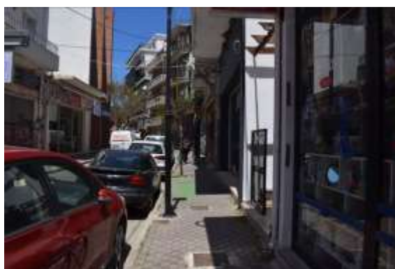
Ανεπαρκής φωτισμός και εμποδιζόμενη κίνηση