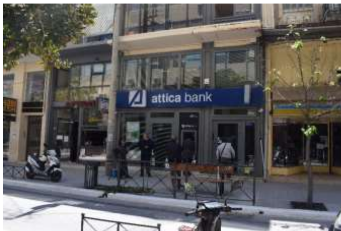
Σταθμευμένα μηχανάκια (οδός Κόρακα και Κριάρη) και εκτός προδιαγραφών κάγκελα