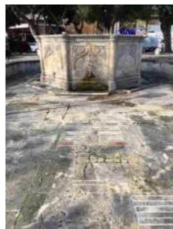
Η εσωτερική διαδρομή ανάμεσα στις σκάλες προς τα υπόγεια wc και οι εμφανείς φθορές στο περιβάλλον της κρήνης.