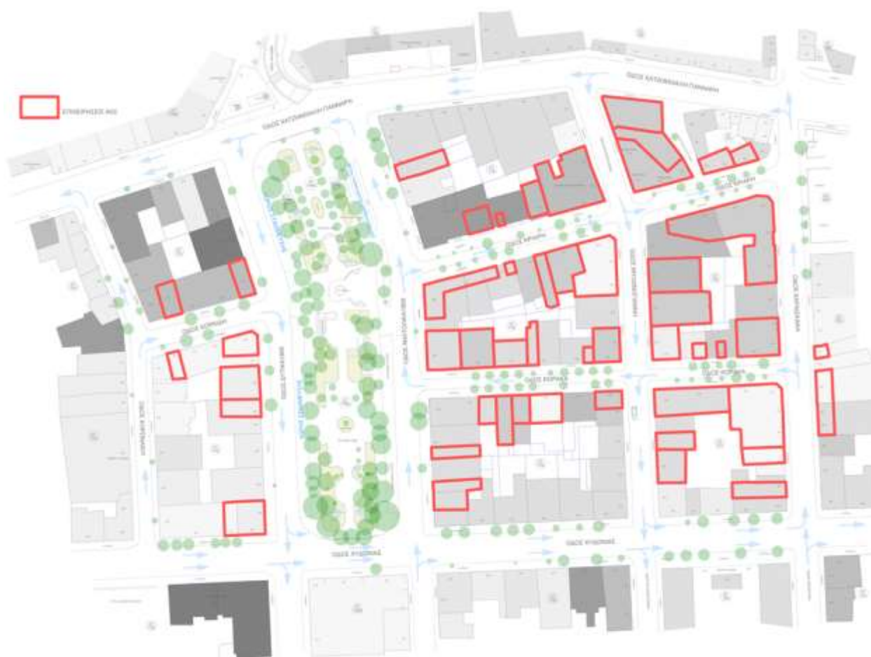
Υφιστάμενη κατάσταση περιοχής και επιχειρήσεις που συμμετέχουν στην πράξη.