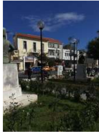
Δέντρα που δεν αναπτύχθηκαν σωστά και χαμηλή φύτευση που αποτελεί εμπόδιζε την διαμπερή επικοινωνία