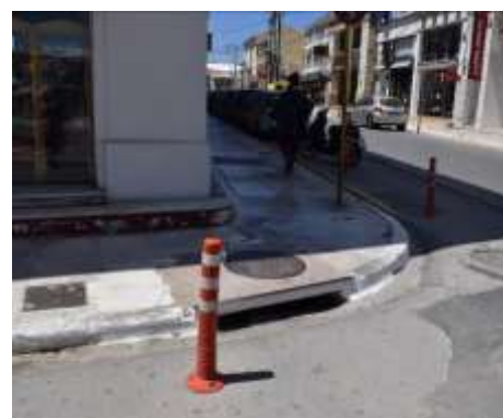
Υφιστάμενη διαχείριση όμβριων – μη προσβάσιμες διασταυρώσεις (Μυλωνογιάννη και Σκαλίδη)