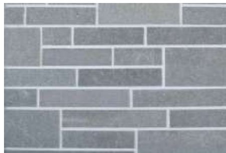
Κομμένη πλάκα Καβάλας