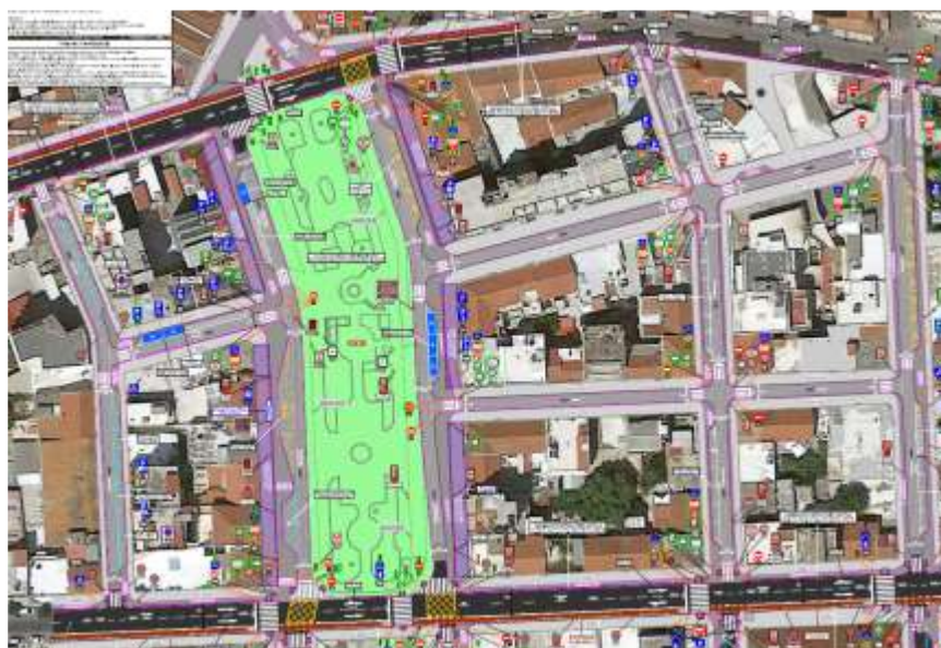
Σχέδιο κυκλοφορικών ρυθμίσεων