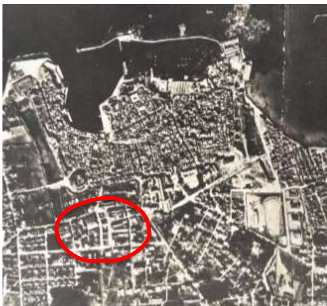
Αεροφωτογραφία και φωτογραφία από το 1938

Η ανάπτυξη ενός νέου εμπορικού κέντρου έξω από τα τείχη της Παλιάς πόλης σε συνδυασμό και με την ανέγερση και λειτουργία από το 1913 της κλειστής Δημοτικής Αγοράς συνοδεύτηκε από την ανάγκη σχεδιασμού μιας κεντρικής πλατείας αναφοράς για την πόλη, με κυρίαρχο στοιχείο το πράσινο, σύμφωνα και με τα πρότυπα της εποχής.