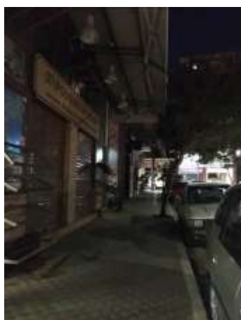
Απουσία φύτευσης στην οδό Μυλωνογιάννη