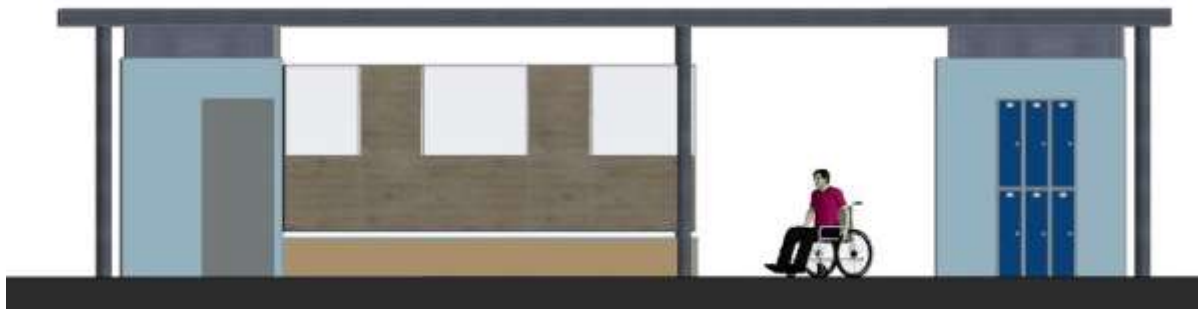
Μεταλλικό στέγαστρο με χρήση εξυπηρέτησης της πλατείας.