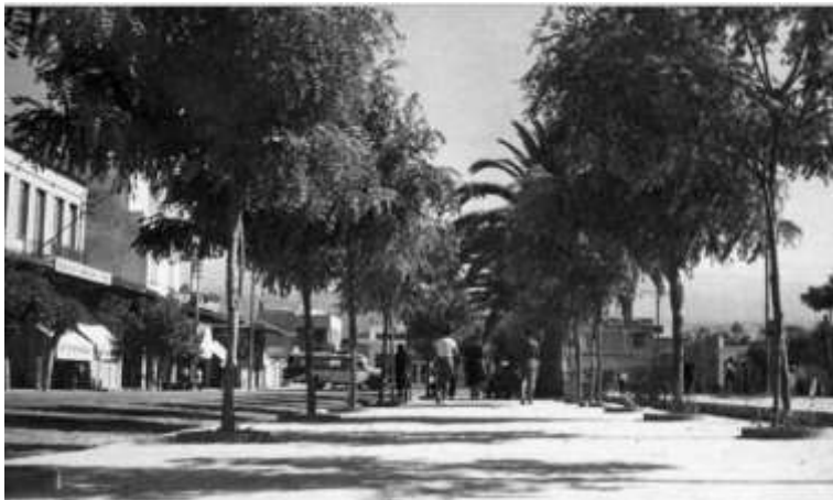
Οι φυσικές σκιερές διαδρομές σήμερα και με τις αρχικές αναπλάσεις της πλατείας