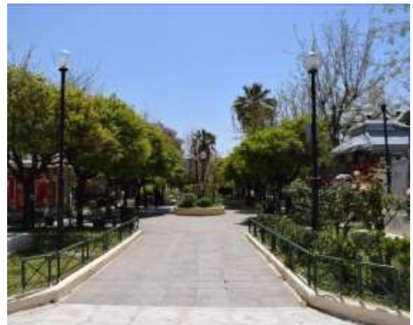
Η πλατεία υποδέχεται αλλά η κεντρική της διαδρομή έχει εμπόδια