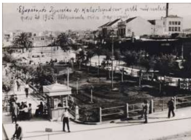
1952 μετά την απομάκρυνση των κατασκευών εξωραϊσμός με φυτεύεις.

Ακολουθεί συνολική αναμόρφωση της πλατείας, με μεγάλους χώρους πρασίνου. Στα νέα συμμετρικά παρτέρια κυριαρχούν κηποτεχνικές διαμορφώσεις ενώ οι βασικές διαδρομές των πεζών αναπτύσσονται περιμετρικά ανάμεσα από δεντροστοιχίες . Στην πλατεία τοποθετούνται την εποχή αυτή προτομών τοπικών ηρώων.