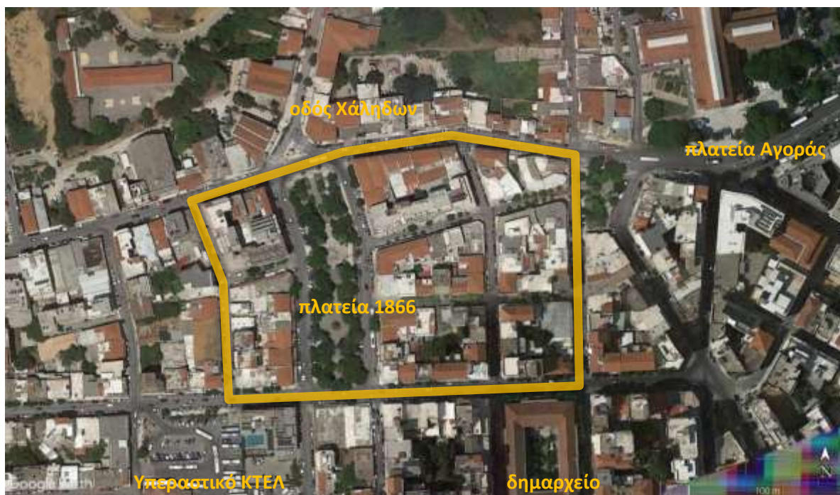
Αεροφωτογραφία περιοχής με σημαντικά τοπόσημα

Η παρέμβαση αφορά σε συνολική έκταση 14.800 τ.μ. δημόσιου χώρου από τα οποία τα 4.500 τ.μ. αποτελούν την Πλατεία 1866 και τα υπόλοιπα 10.300 τ.μ. αποτελούν τους χώρους κίνησης και στάσης, πεζών και οχημάτων, στα οικοδομικά τετράγωνα και τις οδούς γύρω από την πλατεία.