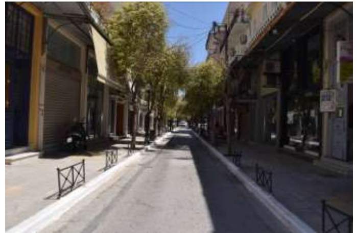
Η πλατεία χωρίς στάθμευση με τον πραγματικά διαθέσιμο χώρο και το καλό παράδειγμα της οδού Κόρακα

Παράλληλα στο δίκτυο των εμπορικών δρόμων του Ανοικτού Κέντρου Εμπορίου το παράδειγμα των διευρυμένων και δεντροφυτεμένων πεζοδρομίων στις οδούς Κορκίδη , Κριάρη και Κόρακα αποτελεί βιωματικό παράδειγμα για τα οφέλη της απομάκρυνσης των οχημάτων από την περιοχή . Έχει έτσι ήδη αναδειχτεί η ανάγκη μετατροπής της περιοχής αυτής σε ζώνη ήπιας κυκλοφορίας και τα θετικά αποτελέσματα μιας τέτοιας κυκλοφοριακής καταρχήν ρύθμισης.