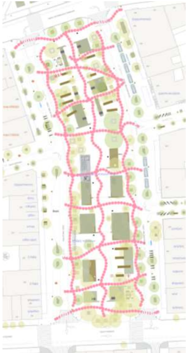
Πρόταση ανάπλασης πλατείας 1866 και διάγραμμα δυνατότητας ανεμπόδιστων κινήσεων