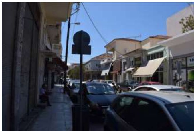
Στενά πεζοδρόμια και κυρίαρχη η παρουσία οχημάτων (οδός Καραϊσκάκη)