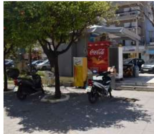
“Τοίχος” από σταθμευμένα οχήματα και μηχανές σταθμευμένες και μέσα στην πλατεία