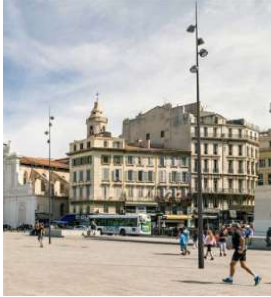
Ενδεικτικά φωτιστικά σώματα οδών και πλατείας