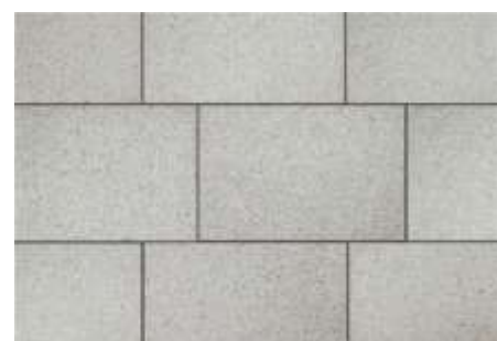
Γκρι γρανίτης σαγρέ