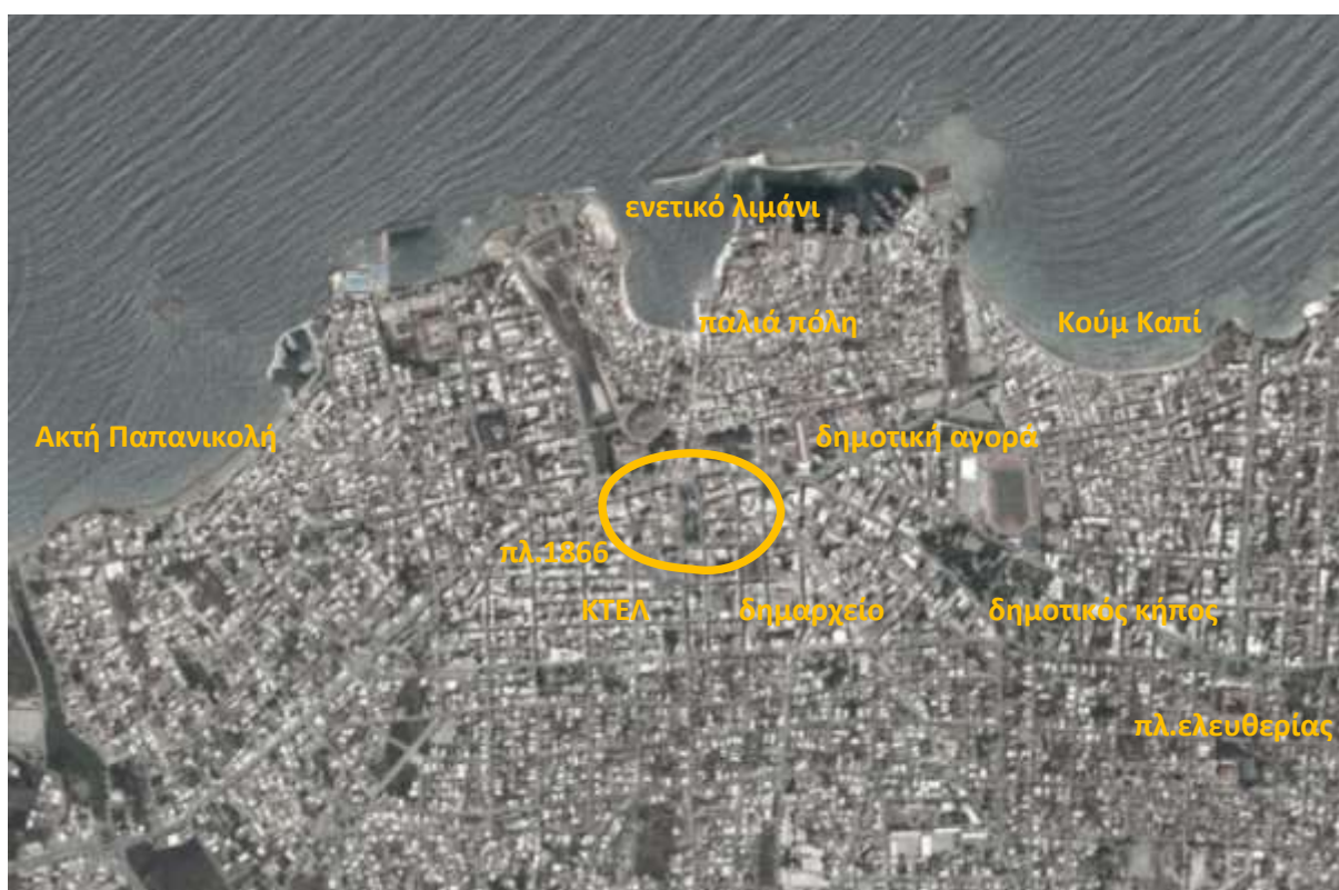
Αεροφωτογραφία Χανίων με τοποσημα και περιοχή παρέμβασης.

Η προτεινόμενη περιοχή παρέμβασης βρίσκεται στο κέντρο της πόλης και περιλαμβάνει την Πλατεία 1866 και τους γύρω δρόμους, όπου εδρεύει μεγάλος αριθμός εμπορικών επιχειρήσεων και αποτελεί κεντρικό κυκλοφοριακό και εμπορικό κόμβο της πόλης.