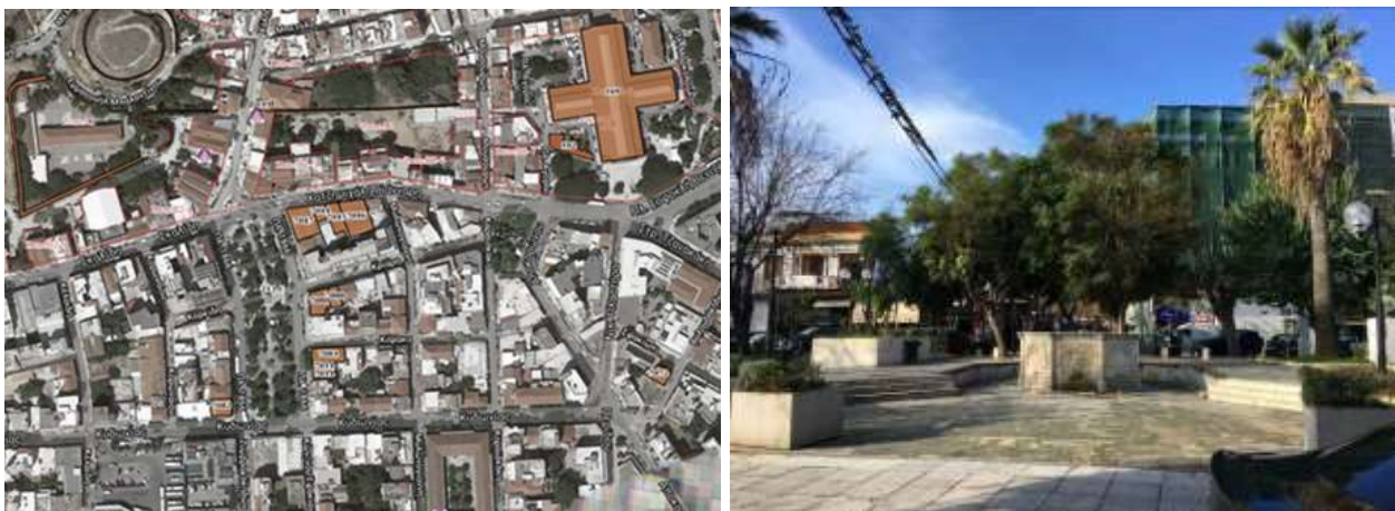
Καταγραφή διατηρητέων κτιρίων περιοχής και διατηρητέας οθωμανικής κρήνης.