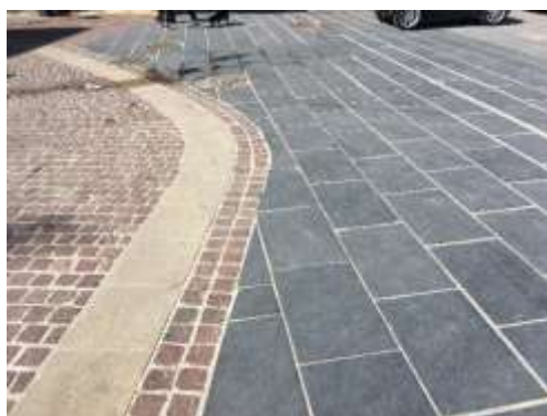
Κυβόλιθος πορφυρίτη στην οδό Χάληδων

Στο κέντρο της πλατείας και γύρω από την κλίμακα καθόδου προς τα υπόγεια δημόσια WC κατασκευάζεται μικρό μεταλλικό στέγαστρο με στήριξη σε μεταλλικές κοιλοδοκούς κυκλικής διατομής και επιφάνεια από πάνελ πολυουρεθάνης σε πλαίσιο μεταλλικής λαμαρίνας . Στο στέγαστρο περιλαμβάνονται και οι χώροι εξυπηρέτησης της πλατείας (WC ΑΜΕΑ, αποθήκη , χώρος ΗΜ εγκαταστάσεων) που κατασκευάζονται με μεταλλικό σκελετό και στοιχεία πλήρωσης από εταλμπόν. Στο στέγαστρο τοποθετείται επίσης αυτόματος πωλητής εισιτηρίων αστικών λεωφορείων . Το άνοιγμα της σκάλας προστατεύεται από μεταλλική κατασκευή με στοιχεία πλήρωσης από κόντρα πλακέ θαλάσσης και εταλμπόν όπου μπορούν να αναρτηθούν χάρτες της πόλης ενώ θα υπάρχει και η δυνατότητα της εγκατάστασης μεταλλικού ρολού για τον αποκλεισμό της πρόσβασης στο υπόγειο εάν αυτό κριθεί αναγκαίο.