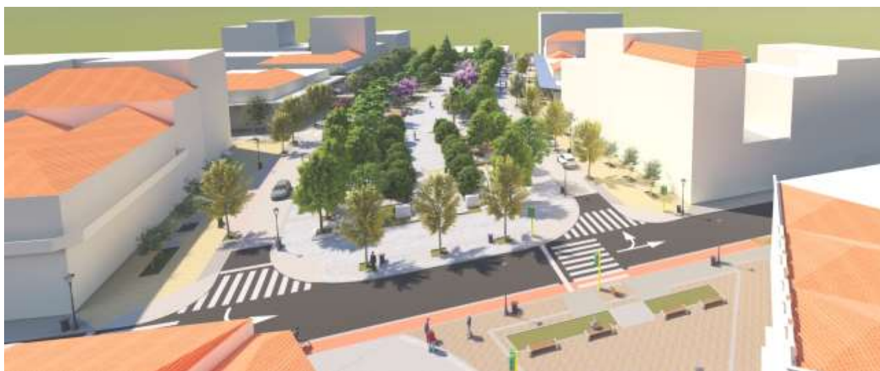
Νέα είσοδος σε περιοχή ήπιας κυκλοφορίας