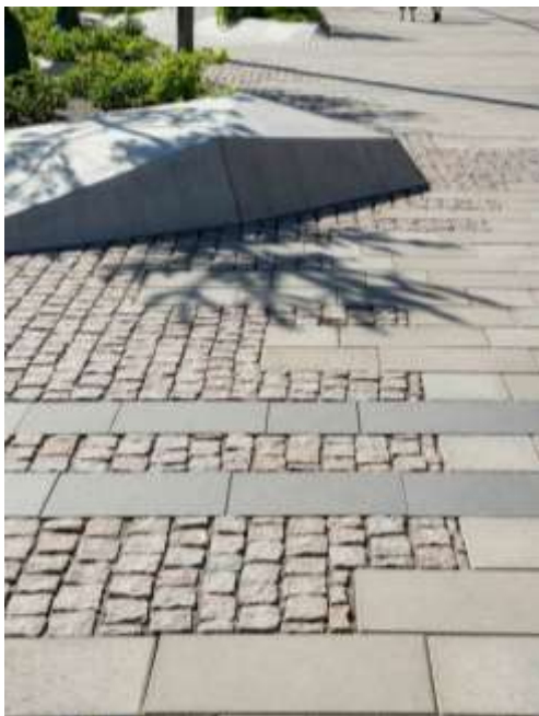
Προτεινόμενος τρόπος πλέξης υλικών στην πλατεία

Η πλατεία επιστρώνεται με κομμένες πλάκες Καβάλας σε ζώνες πλάτους 20 εκ. , 30 εκ και 40εκ (τρεχόμετρα) . Οι περιοχές διαχωρίζονται από φιλέτα ανοικτού γκρι γρανίτη με σαγρέ επιφάνεια αντίστοιχα με τα φιλέτα διαχωρισμού κίνησης οχημάτων. Γύρω από τις περιοχές πρασίνου και για την οπτική ενοποίηση της οδού Χάληδων με τον άξονα της πλατείας και την νέα πόλη, τοποθετούνται κυβόλιθοι πορφυρίτη , που είναι το κυρίαρχο υλικό επίστρωσης της Παλιάς Πόλης. Τα νέα υλικά πλακόστρωσης με την ενιαία και προσεγγμένη τους επιφάνεια διαχωρίζουν την πλατεία από την υπόλοιπη σύγχρονη εμπορική πόλη χωρίς να την αποκόπτουν χρωματικά .